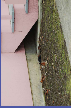
en tierra descubierta

www.cdph.ca.gov/Programs/CEH/DFDCS/Pages/FDBPrograms/FoodSafetyProgram/LeadInCandy.aspx