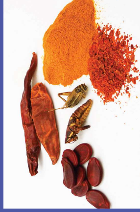
en alimentos y especias de color brillante provenientes del extranjero