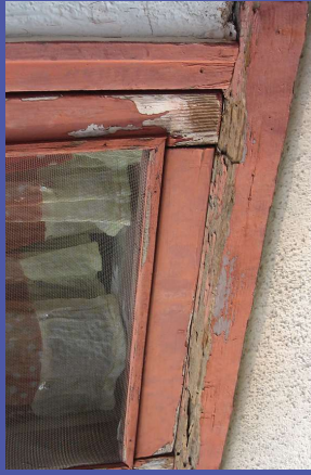
en pintura descarapelada