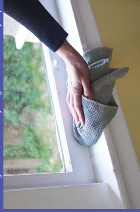
en el polvo de la casa