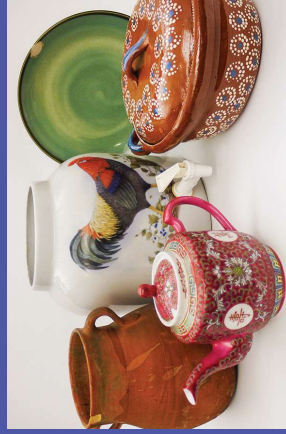
en algunos trastes y ollas