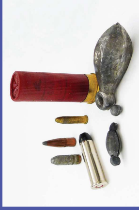
en balas y en el plomo de pescar