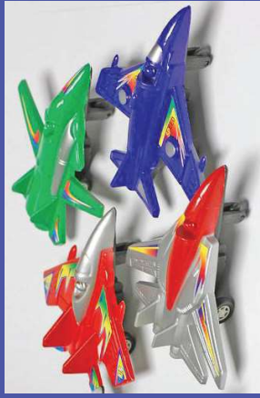
en algunos juguetes