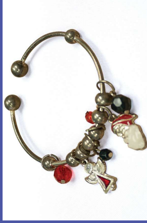
en algunas joyas

https://dts.ca.gov/toxics-in-products/lead-in-jewelry/