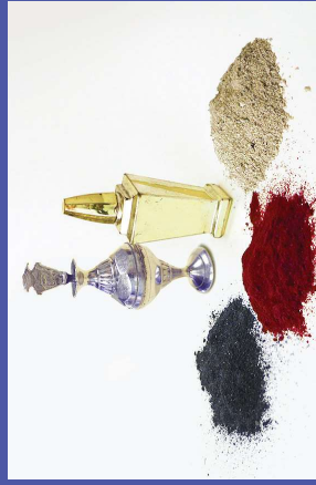
en cosméticos tradicionales, como el kohl, surma o sindoor